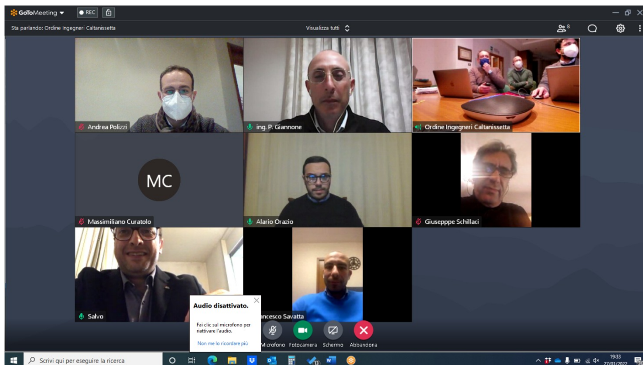
Figura 1 Screen shot inizio riunione di Consiglio

Il Consigliere Segretario ha verificato l'assenza di persone non appartenenti al Consiglio dell'Ordine territoriale di Caltanissetta e ha constatato, attraverso la trasmissione video e apposito screen shot della videoconferenza (in allegato al presente verbale), che ogni Consigliere partecipante abbia adottato gli accorgimenti di cui al comma 4 dell'art. 3 del già menzionato regolamento.